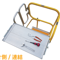
片側 / 連結