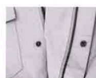
ジップファスナー+ボタン