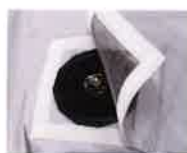
ステンレスメッシュカラー