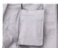
内側・バッテリーポケット