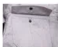
ボタン付き胸ポケット