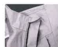
ファスナーカラー