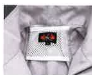
背面・襟部立体構造