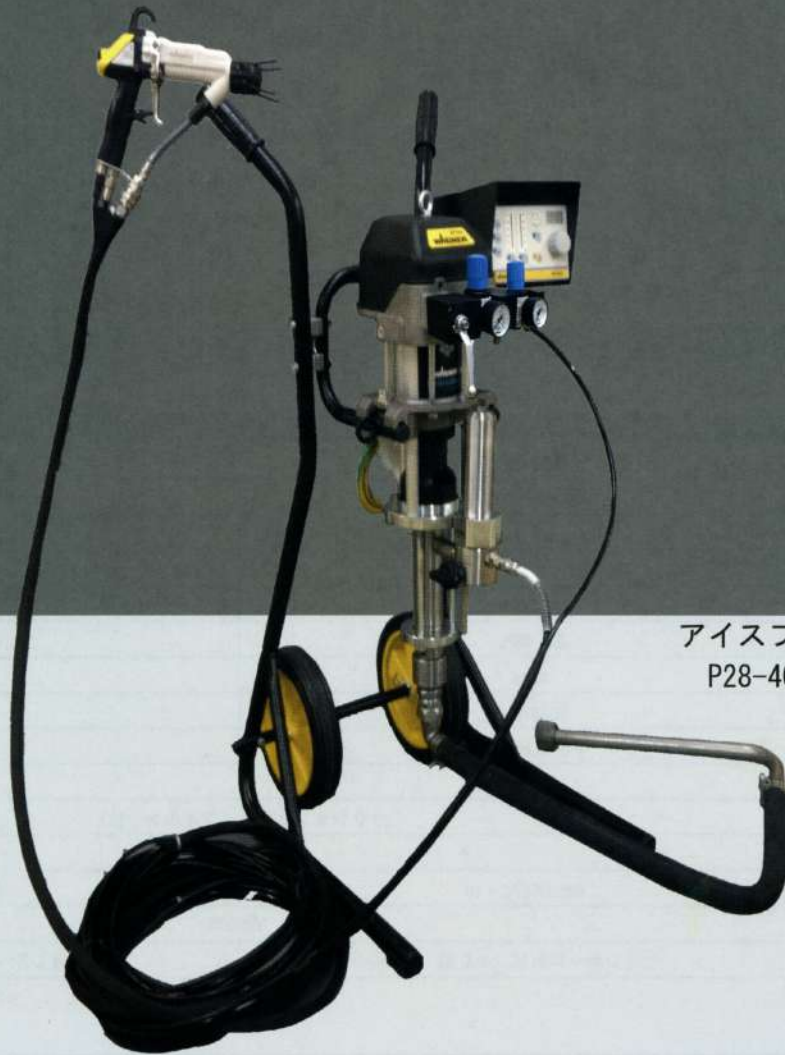
アイスブレイカーシリーズ P28-40EAC

最高の塗着効率を目指すお客様へ、 ハイテクノロジーが生み出した 驚異の塗装レベル！