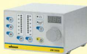
コントロールユニット VM5000