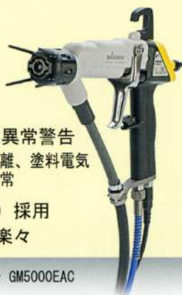
エアークート静電ガン GM5000EAC