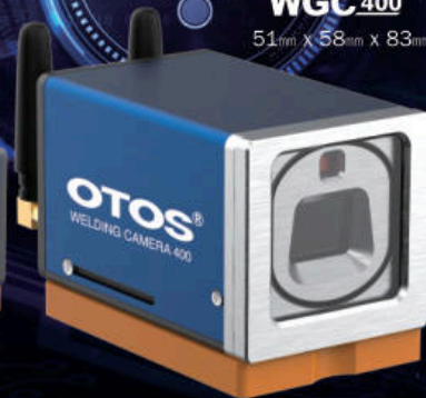
WGC400 51mm x 58mm x 83mm