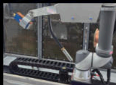
Automation & Robot