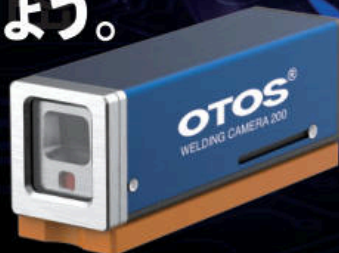
WGC200 30mm x 40mm x 104mm