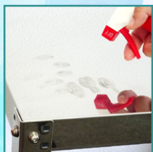
ステンレスの手あか汚れ