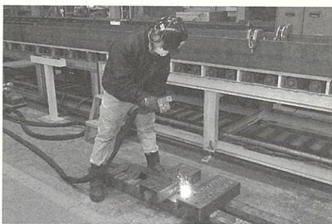
作業員にかかる負担が4分の1に

野が下支えしている状況」との認識を示す。先(川村)使用している。導入前と比べて作業員にかかる負担が4分の1にまで減ったという。黒皮だけではなく錆やペンキも除去できるため、今後さまざまな用途への活用に期待を寄せている。同社鉄工事業部の売上高は約20億円。月間加工能力500〜600ト。受注物件の規模は1000〜3000トがメイン。受注残は確定しているもので1年。打診を受けているのも合わせる到来年いっぱいまで。